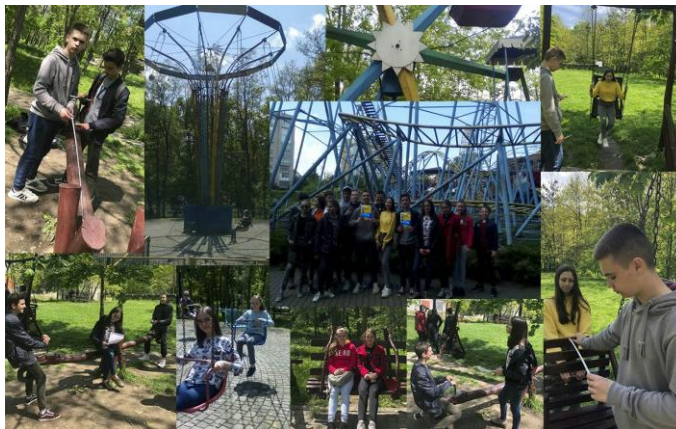
Рис.5. Захід «Фізика вихідного дня»

Сам термін «презентація» означає представлення чогось нового. Мультимедійна презентація — це представлення інформації з використанням мультимедійних технологій: відео, аудіо, 3D моделей, рисунків, фотографій, тексту, анімації та навігації. Мультимедійна презентація може бути інтерактивною, тобто, користувач, що переглядає презентацію, може певним чином впливати на матеріал, що відображається в той чи інший момент.