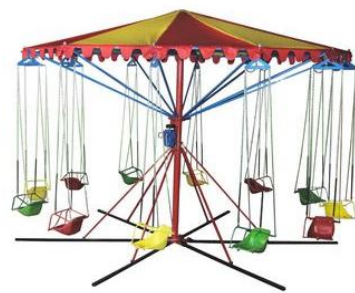
Рис.1. Ланцюгова карусель