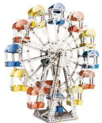
Рис.4. Колесо огляду