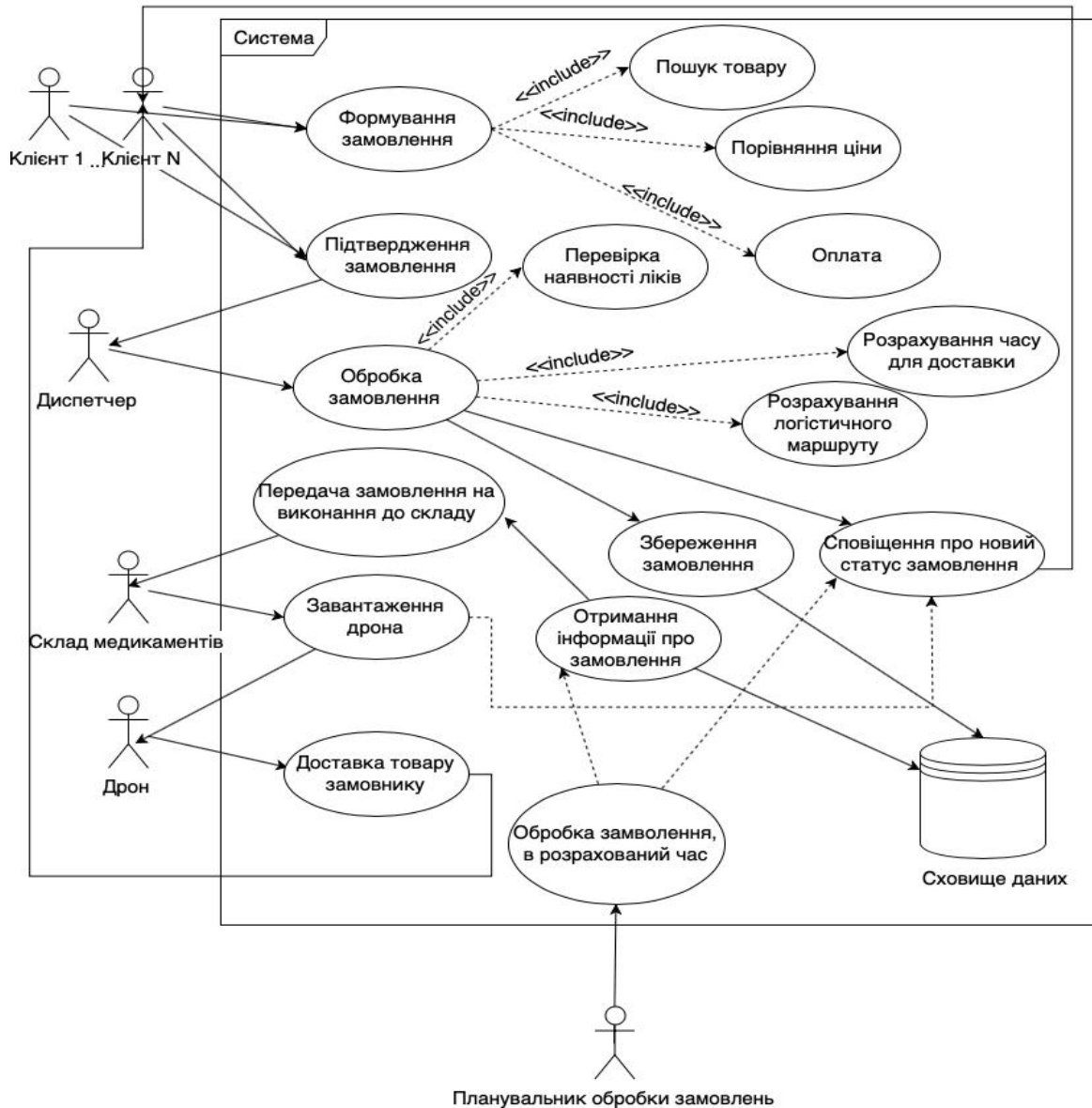
Рис. 3. Діаграма випадків використання концептуальної системи

У ході проведеного дослідження було виявлено світовий тренд у розробці таких систем, та зацікавленість українських компаній у дослідженні цієї теми. Не було знайдено жодної інформації про дослідження українських компаній в сфері доставки медикаментів за допомогою дронів, що робить можливим припущення про актуальність такої системи на території України.