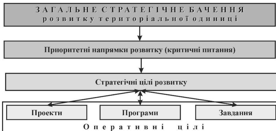
Рис. 3. Модель ініціації проектів в публічній сфері

Тому далі визначимо більш детально засади ініціації проектів в публічній сфері на прикладі проектів розвитку територіальних громад. Наведені фахівцями рекомендації в галузі планування розвитку територіальних громад [7], дозволяють побудувати наступну модель ініціації відповідних проектів розвитку, представлену на рис. 3, розробленому авторами дослідження.