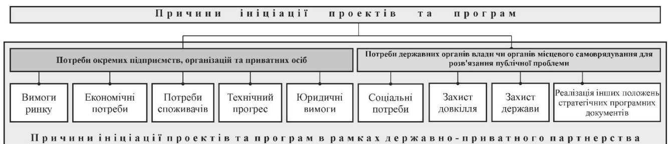
Рис. 1. Класифікація причин ініціації проектів та програм

Отже, традиційні принципи класифікації причин ініціації проектів, розглянуті у попередніх дослідженнях [1], потребують доповнення загальною метою ініціації проектів в публічній сфері – а саме: необхідністю втручання державних органів влади чи органів місцевого самоврядування для розв'язання публічної проблеми з застосуванням проектного підходу. Доповнена класифікація причин ініціації проектів та програм наведена на рис. 1, розробленому авторами.