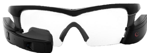
Рисунок. 4. Окуляри доповненої реальності Intel/Recon Jet Pro.

Для того, щоб не відволікати увагу людини, яка використовує дану систему від виконання службових обов'язків, та своєчасно попереджати його про небезпеки, виявлені датчиками, дуже доцільно виводити отриману інформацію в поле зору оператора, накладаючи його на зображення оточуючої реальності. Для цього було вирішено використати окуляри доповненої реальності Intel/Recon Jet Pro [9].