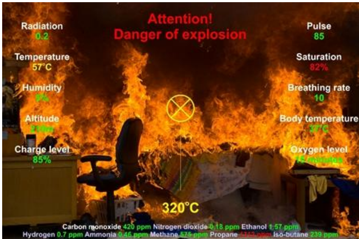
Рисунок. 5. Поле зору пожежника з показниками сенсорів які накладаються на зображення реального світу

Система персональної телеметрії дозволяє в реальному часі аналізувати отримані від первинних датчиків дані за рахунок вбудованого мікро контролера, і при виникненні критичних фізіологічних показників, передавати їх медикам швидкої допомоги, дільничному лікарю або в центр стеження за станом здоров'я співробітників служб порятунку. Аналіз комбінації показників різних датчиків дає додаткову інформацію. Наприклад, різке зменшення атмосферного тиску разом з даними акселерометра сповіщає про падіння людини (з точністю краще за 20 см), а підвищення тиску (і прискорення), про можливий вибух. Пристрій може бути доповнений або ж спрощений за рахунок видалення зайвих датчиків в залежності від передбачуваного використання. Розроблено прототип з мінімально необхідною кількістю сенсорів з дистанційним доступом по WEB-інтерфейсу. Масове використання аналогічних систем дозволить суттєво покращити показники виживання при інфаркті міокарда, інсульті, виникненні надзвичайних станів і т. д.