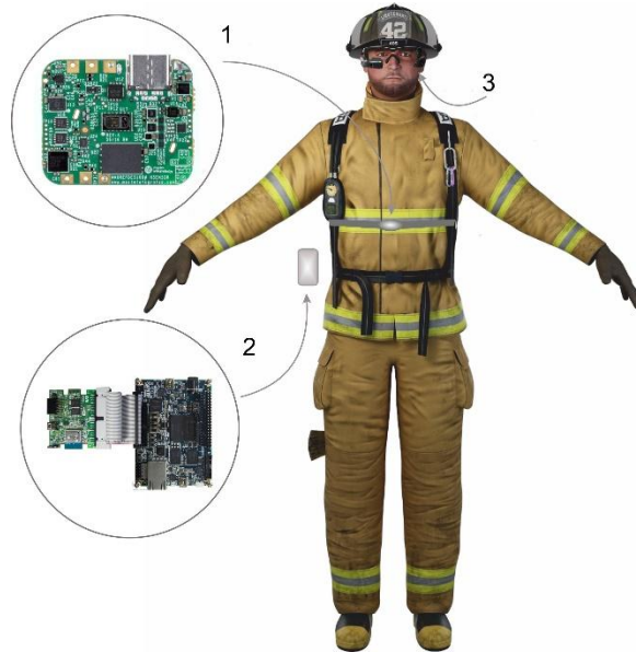
Рисунок 1. Блок-схема системи телеметрії з елементами доповненої реальності. 1 - модуль спостереження за фізіологічним станом, 2 – модуль аналізу оточення, 3 – окуляри доповненої реальності Intel/Recon Jet Pro

пірометр MLX90614ESF-DCI-000-SP фірми Melexis [5], який дистанційно визначає температуру об'єкту, на який дивиться співробітник, а вимірні значення поступає в модуль 2. Всі отримані та попередньо оброблені дані передаються по інтерфейсу Bluetooth LE на окуляри доповненої реальності фірми Intel/Recon Jet Pro. Ці значення відображаються в полі зору оператора, накладаючись на зображення реального світу (технологія Доповненої Реальності – Augmented Reality).