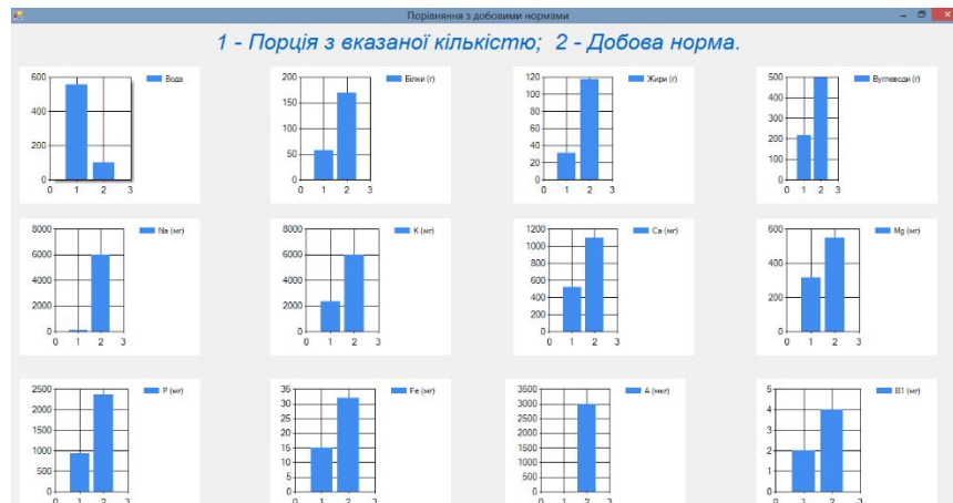
Рис. 3. Модуль візуалізації

6. Модуль візуалізації (рис. 3) дозволяє в графічній формі представити результат оцінки параметрів фактичного раціону та порівняння його з оптимальним та добовими потребами. Візуальне представлення та порівняння результату значно розширює презентаційні можливості програмного продукту, та дозволяє подати результати його роботи в зручному та наочному вигляді.