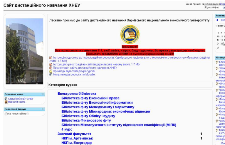
Рис. 2 Сайт дистанційного навчання Харківського національного економічного університету

До списку сайтів дистанційного навчання, побудованих на системі CMS Moodle відноситься і сайт дистанційного навчання Харківського національного економічного університету (ХНЕУ), http://www.ikt.hneu.edu.ua/ [3] (рис. 2). Даний сайт являється також основним джерелом здобуття навчального матеріалу згідно обраної спеціальності студентами вузу через Інтернет-комунікацію з ним та дуже вагомою допомогою для контингенту його викладачів.