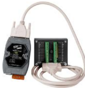
Рис. 4. Загальний вигляд інтелектуального модуля вводу-виводу WISE-7118Z

Для полегшення процесу автоматизації компанія «ICP DAS» пропонує використовувати інтелектуальний модуль вводу-виводу WISE-7118Z. Загальний вигляд інтелектуального модуля наведено на рисунку 4.