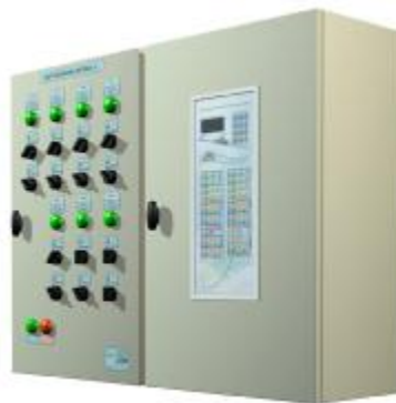
Рис. 6. Загальний вигляд кліматичного комп'ютера

Фірма «ФИТО» пропонує системи управління мікрокліматом теплиць серії FC. Зокрема загальний вигляд кліматичного комп'ютера цієї фірми відображено на рисунку 6.