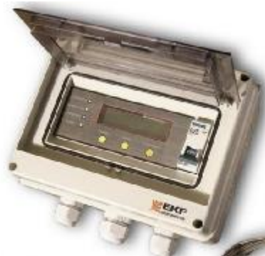
Рис. 1. Загальний вигляд пульта управління мікрокліматом.

ЕКФ - одна з провідних компаній електротехнічної галузі, що працюють в середньому ціновому сегменті, що займається випуском повного асортименту високоякісної низьковольтної продукції. Апаратний доробок для регулювання мікроклімату зображений на рисунку 1.