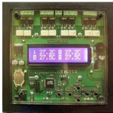
Рис. 2. Загальний вигляд блоку керування мікрокліматом

ЕКФ пропонує також 8-ми каналний блок керування мікрокліматом в теплиці на базі мікроконтролера DS1820, загальний вигляд якого зображено на рисунку 2.