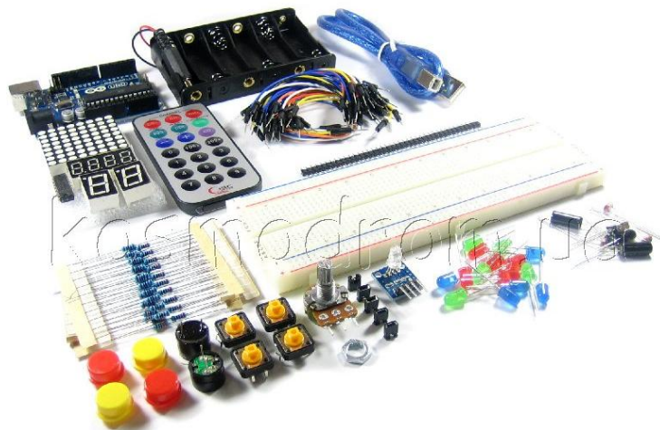
Рис. 1. Зовнішній вигляд набору ARDUINO-LITE-KIT

Для моделювання пристрою ІЧ-давача використано наступні електронні компоненти: плата Arduino Uno R3, USB-кабель, з'єднувальні провідники, інфрачервоний давач та пульт ДК (рис. 2)