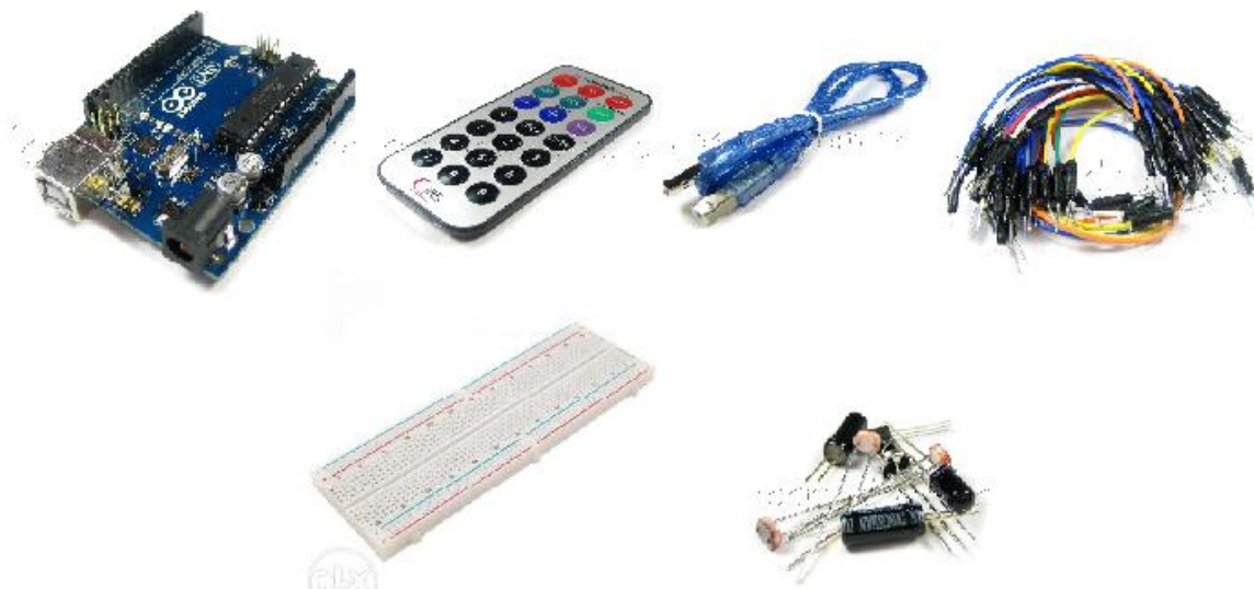
Рис. 2. Електронні компоненти для макетування ІЧ-давача

Для моделювання пристрою ІЧ-давача використано наступні електронні компоненти: плата Arduino Uno R3, USB-кабель, з'єднувальні провідники, інфрачервоний давач та пульт ДК (рис. 2)