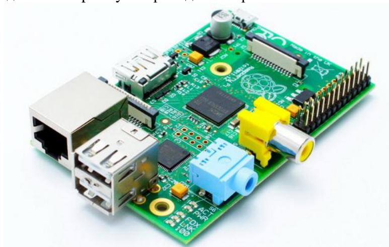
Рис. 1. Плата Raspberry Pi

Основою платформи є плата Raspberry Pi — одноплатний комп'ютер на процесорі ARM11 Broadcom BCM2835 з тактовою частотою 700 МГц і модулем оперативної пам'яті на 256/512МБ. Вигляд плати Raspberry Pi приведено на рис. 2.