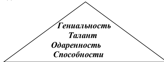
Рис. 1 Структурные основы предпосылок творчества

Структурные основы предпосылок к творчеству на основе природных задатков представим на рис. 1 и последовательно ознакомимся с ними.