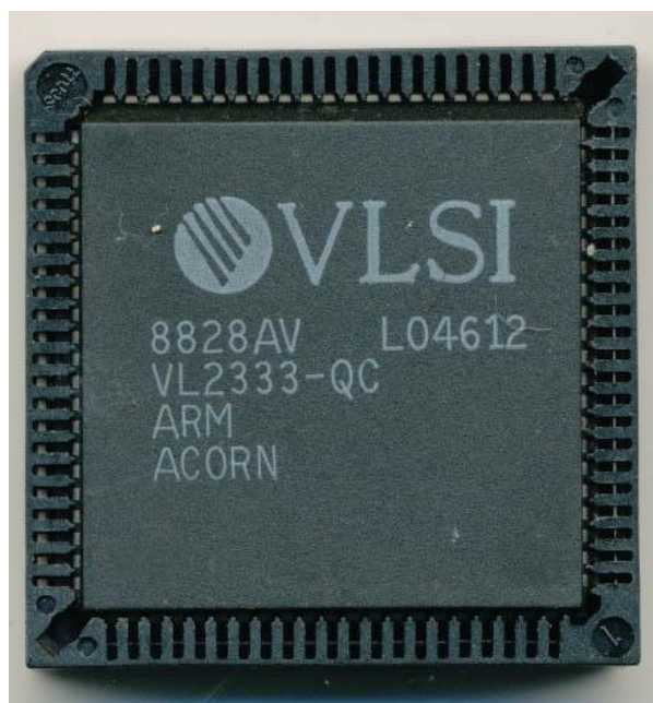
Рис. 2. Чіп ARM1 - первісток компанії Acorn Computers, який проводився на фабриках VLSI

Особливості та порівняння архітектури ARM. Почати варто з того, що в процесорній архітектурі x86, яку зараз використовують компанії Intel і AMD, застосовується набір команд CISC (Complex Instruction Set Computer), хоч і не в чистому вигляді. Так, велику кількість складних за своєю структурою команд, що довгий час було відмінною рисою CISC, спочатку декодуються в прості, і тільки потім обробляються. Ясна річ, на весь цей ланцюжок дій йде чимало енергії.